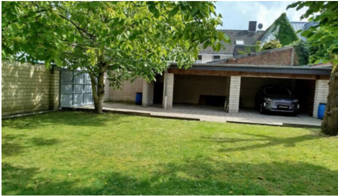
Garagen und Einfahrtbereich